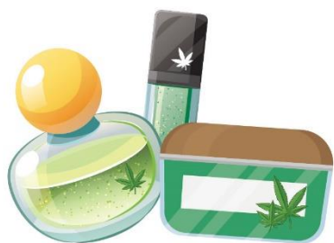
違法添加管制成份 大麻用品