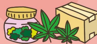
代購國外不明物品